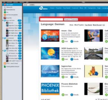
MIRO: Přehrávač nabízí i speciální německé kanály se zpravodajstvím a dokumentárními seriály.

→ kávaného „televizního zážitku“ spatříte následující zprávu: „The Zattoo network is busy. Please try again later.“