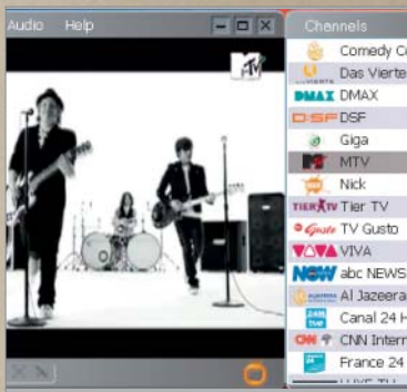
ZATTOO: Zaměřen na speciální kanály, jako je například MTV. Filmových kanálů zde najdete jen málo.