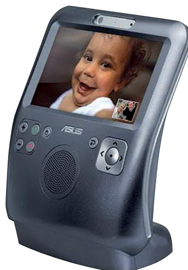
Budoucnost je ve videu: Velkou výhodou Skypu jsou videohovory. Prodávají už se dokonce i videotelefony pracující nezávisle na počítači. Toto je Asus AiGuru SV1.