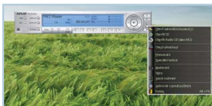
Intuitivní: Ovládání Mv2Playeru je velice podobné stolnímu DVD přehrávači.

Mplayer si poradí s naprostou většinou multimediálních souborů i DVD disků. Výhodou je totiž snadná instalace dalších kodeků. Kodeky stačí jednoduše stáhnout z domovských stránek Mplayeru, nakopírovat je do určeného adresáře a Mplayer je tak dokáže využít.