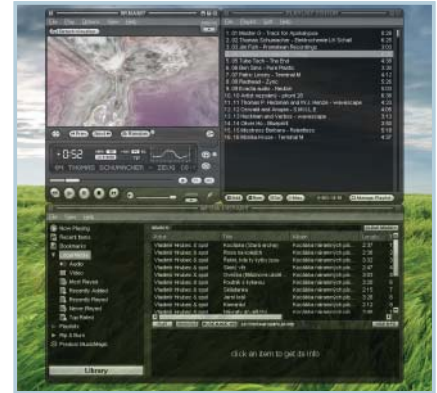
Legenda: Winamp prošel dlouhým vývojem až do současné podoby.

Mv2Player vyniká kvalitní nabídkou funkcí při přehrávání multimediálních souborů a díky kompletní české lokalizaci má šanci stát se hlavním používaným přehrávačem mnoha českých uživatelů.