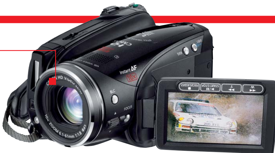
Foto / video