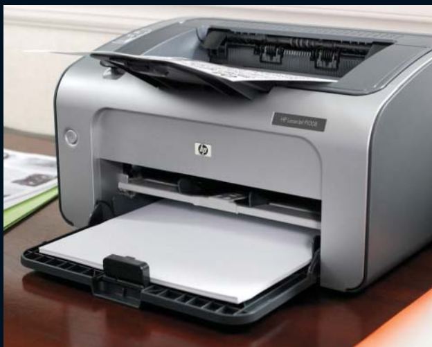
HP LASERJET P1005, P1006, P1505