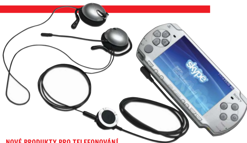
NOVÉ PRODUKTY PRO TELEFONOVÁNÍ