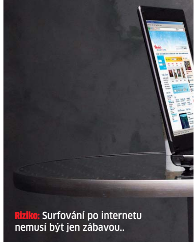
Riziko: Surfování po internetu nemusí být jen zábavou..

Jedním z nejčastějších omylů, co se týká kyberšikany, je názor, že jde o výjimeč-