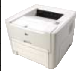
Černobílé laserové tiskárny

Barevné dokumenty jsou hezčí než černobílé, ale jsou dražší. Buď zaplatíte celkem dost za barevnou laserovou tiskárnu, nebo hodně za provoz barevné inkoustové tiskárny. Pro běžnou agendu však stačí tiskárna černobílá. Pořizovací náklady jsou nízké, náklady na tisk také.