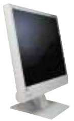
Monitor LCD 19"

Konečně jsme se dočkali zřetelného poklesu cen TFT monitorů - devatenáctpalcové modely už lze porovnat za ceny od 6000 Kč. Kdo chce něco udelat pro své oči, poradí si místo 17" TFT monitoru raději devatenáctpalcový. Oba sice mají stejné rozlišení (1280 × 1024 pixelů), ale „devatenáctka“ omeď 1,3 miliónu obrazových bodů zobrazuje na ploše o 25% větší. Díky tomu lze od displeje odrazet větší odstup a práce s ním pak méně namáhá zrak.