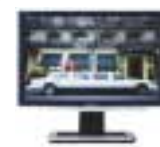
Monitor LCD 20"

Širokoúhly obraz je momentálně v móde. Čím větší, tím lepší. Stále více uživatelů proto v případě TFT monitorů sází na 20palcové modely formátu 16 : 10. Ty totiž nabízejí vysoké rozlišení 1680 × 1050 obrazových bodů za ceny, které začínají už na 8000 Kč. 20palcové TFT monitory nabízejí o 35 procent víc obrazu než klasické 19palcové monitory, a přesto nejsou o moc dražší.