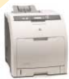
Barevné laserové tiskárny

Barevné dokumenty vypadají lépe než černobílé a mají větší i vyšší vypovídací hodnotu. Laserové tiskárny jsou sice dražší než inkoustové tiskárny, jejich provozní náklady jsou však mnohem nižší, takže pokud plánujete větší objem tisku, „laserovka“ se vyplácí. V našem přehledu najdete modely s cenou už od 7000 Kč.