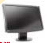
Monitor LCD 24"

24palcové TFT displeje nabízejí s rozlišením 1920 × 1200 téměř dvakrát více místa než 17- či 19palcové modely. Otevírají jsme pro vás šest těchto monitorů, tedy v podstatě všechny modely dostupné na našem trhu.