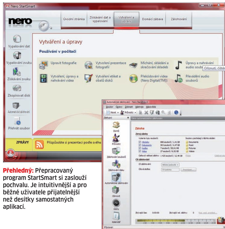
Přehledný: Přepracovaný program StartSmart si zaslouží pochvalu. Je intuitivnější a pro běžné uživatele přijatelnější než desítky samostatných aplikací.

Co nemůžeme u Nera StartSmart vystát, to je jeho nenasytnost. Hned po spuštění si úvodní obrazovka ukousne 40 MB RAM, což je hrozná hodnota pro všechny, jejichž počítač není vybaven aspoň 2 GB paměti.