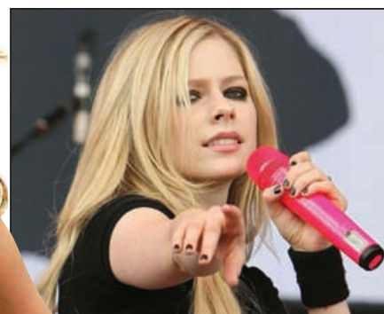
7,3 milionu: Tolik stažených tracků prodala Avril Lavigne se svým songem „Girlfriend“, což je světový rekord.