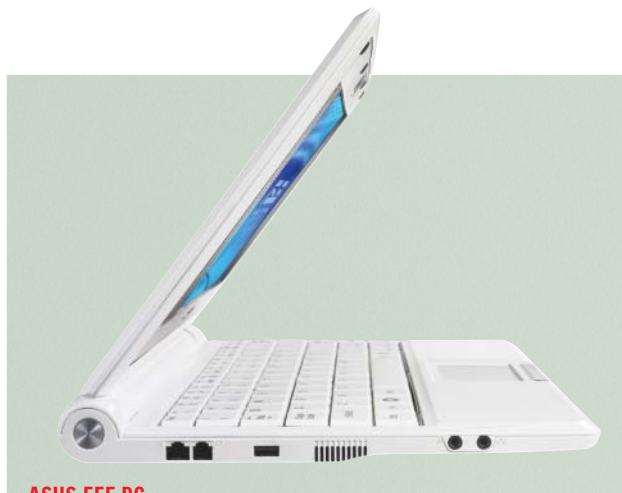
ASUS EEE PC

flashový model jaderné elektrárny, sekci „Otázky a odpovědi“ a aktuální informace o stavu jaderných reaktorů, a to přímo na své hlavní stránce.