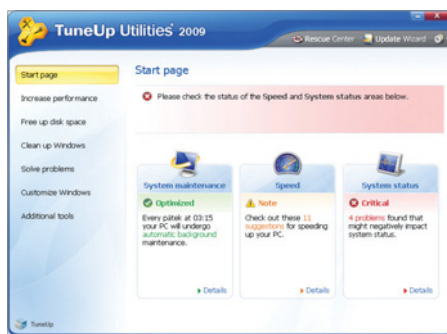
Rychlá diagnóza: Hned po spuštění zkontroluje TuneUp stav počítače.

Pokud jste počítač dostali do vrcholné formy, měli byste ho tak i zachovat. K tomu účelu slouží automatické čištění. Aplikaci byste měli jednou nastavit, a pak se již o nic nestarat. Automaticky by měla provádět údržbu celého systému. Nejrychleji fungoval nástroj Fix-It Utilities: stačí vybrat úkony, které se mají provádět, a nastavit čas. Nic víc není třeba. Bohužel žádný jiný nástroj nenabízí plánovač čištění.