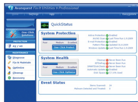
Ochrana systému: Nástroj Fix-It Utilities obsahuje ochranu před viry a malwarem.

ní. Kdo vyžaduje automatické čištění, ten musí sáhnout po funkci »TuneUp Úklid 1 kliknutím«, kterou nabízí TuneUp Utilities. Spouští se však jen jednou týdně a nelze to změnit.