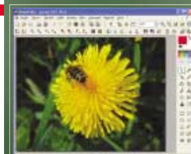
PHOTOFILTRE: Uspokojí i náročnějšího zájemce o úpravu fotografií.

Běžné uživatele, kteří chtějí jenom napravit to, co se pokazilo už při samotném focení, bude ale hlavně zajímat menu „Korekce“. Dobré je, že program vedle ručního nastavení parametrů sází hodně i na automatické volby, takže než se např. obtěžovat s nastavováním různých táhel v okně „Úrovně“, můžete zkusit nastavení