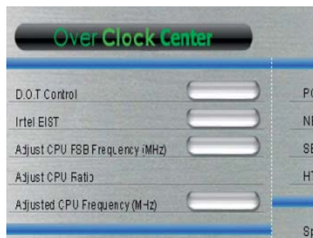
Přetaktování: EFI umí spravovat i to, co BIOS nezvládne. Navíc třeba pohodlně zvládne zvýšit výkon přetaktováním.

Tyto funkce tedy dělají z EFI jakýsi malý operační systém, který má však samozřejmě svoje limity. Komplexní aplikace typu Outlook s plánovacím kalendářem a připojením na exchange server jsou pochopitelně mimo možnosti tohoto