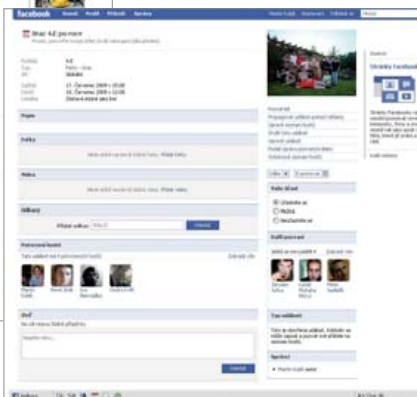
Facebook vizitka: Návštěvníky svého blogu můžete pomocí vizitky upozornit na nové fotografie nebo události.