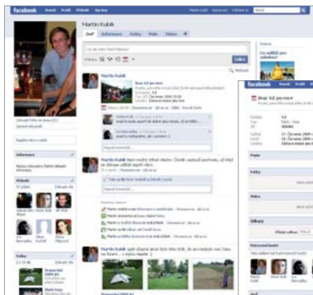
Zed: Na této kartě najdete informace o činnosti daného uživatele za poslední dobu.

Pokud chcete vědět, co nového dělají vaši přátelé, klikněte v horním menu na »Domů«. Zobrazí se stránka, na které