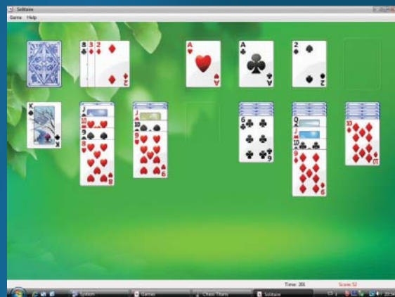
Solitaire: Miláček dámských kanceláří v novém hávu.