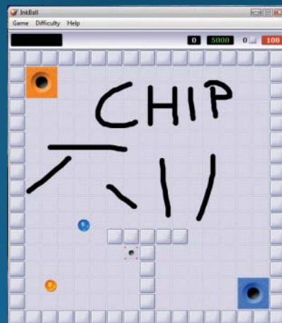
InkBall: Procvičte si fyziku s dvěma koulemi.