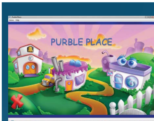
Purple Place: Tři domečky, tři hry pro nejmenší...!

Do druhé kategorie lze zařadit novinky, se kterými se v operačním systému od Microsoftu setkáváme poprvé. Nejprve se podíváme na (podle mého →