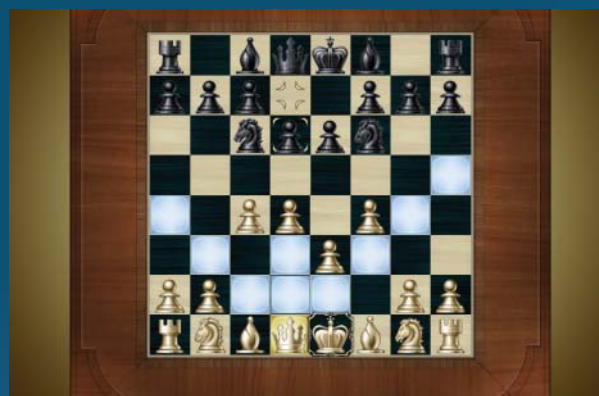
Šachy: Vyhrát dokáže i méně zkušený hráč.

Celkově lze hry ve Windows Vista označit o dva stupně lepším hodnocením, a to nejen ve srovnání s Windows XP. Většinu her sice ocení především děti, ale i pro „kancelářské pracovníky“ bude část nabídky mimořádně lákavá. O budoucnosti Windows Vista se tak můžete přesvědčit sami: až půjdete na úřad vyřídít nějaké papírování a po absolvování hodinové fronty zahlédnete za úřednickovými zády rozehraný InkBall, mohou být Windows Vista prohlášena za úspěšná. ■ ■ ■