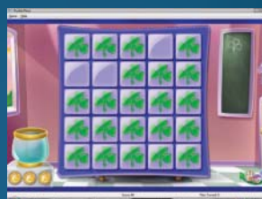
Pexeso: První domeček z Purple Place skrývá zmutované pexeso.