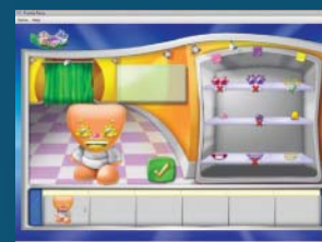
Kreace: Vytvořte si vlastní figurku...