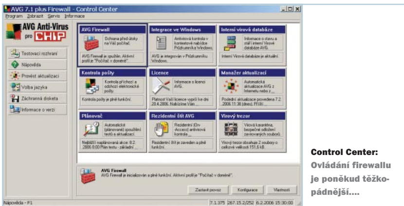
Control Center: Ovládání firewallu je poněkud těžkopádnější....

Stávající uživatelé programu AVG Anti-Virus Chip Edition upozorňujeme, že při této instalaci nestačí pouze vložit nové licenční číslo tak, jak tomu bylo doposud. Je nutné stávající program přeinstalovat novou verzí AVG plus Firewall Chip Edition. Uživatelé, kteří integrovaný firewall nebudou chtít používat, jej mohou po instalaci deaktivovat.