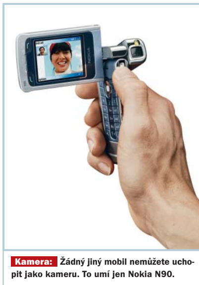
Kamera: Žádný jiný mobil nemůžete uchopit jako kameru. To umí jen Nokia N90.

→ fotografie rozměru 10 × 15 cm. Vynikající je i natáčení videa, které probíhá do formátu MP4. Bez problémů lze nahradit VHS kameru, při natáčení videa je možné používat i digitální zoom, aniž by došlo k degradaci.