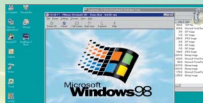
▶ 1998: Windows 98

POMALÝ: Tento OS jen zbytečně zpomalil celou řadu počítačů – opravdovým pomocníkem se stala až verze „Second Edition“.