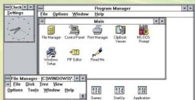
▶ 1992: Windows 3.1

NÁSTAVBA: První Windows s podporou technologie drag & drop nebylo možné bez DOS spustit, i tak šlo ale o průlom v oblasti IT.