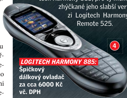
LOGITECH HARMONY 885:

Aby nenastal zmatek kvůli mnoha ovladačům na vašem stole, pořídte si univerzální ovladač. Ten je schopen zaznamenat velké množství informací o vašich přístrojích a všechny bez problému ovládat. Skvělou funkcí jsou též makra, která zmáčknutím jednoho tlačítka např. zapnou reprosoustavu, televizi a DVD přehrávač a zvolí příslušný kanál pro sledování. Jedná se prostě o sérii úkonů, která je vykonána po zmáčknutí zvoleného tlačítka. Pro náročné představujeme ovladač Logitech Harmony 885, pro ty méně zhyčkané jeho slabší verzi Logitech Harmony Remote 525.