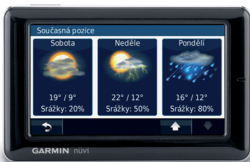
Garmin nüvi 1690: navigace s předpovědí počasí, vyhledáváním na internetu a dalšími on-line službami na území více než patnácti zemí Evropy.

provozu přijde uživatele na 79 eur. Navigační zařízení dále umožňuje provést přepočítání cizích měn podle aktuálních kurzů, zjistit stavy odletů a přiletů, získat rozšířené dopravní informace, vyhledávat pomocí Google local search, zjistit