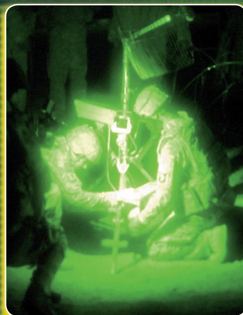
Irák: Američtí vojáci pracují v bojových podmínkách na satelitním zařízení.