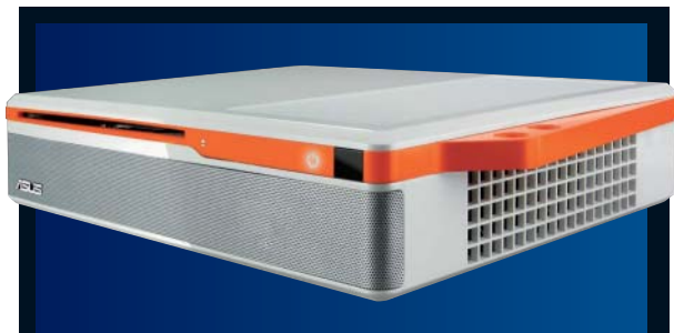
PC ASUS NOVA P22