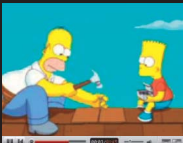
THE SIMPSONS: Trailer k uvedení „žluté hvězdy“ do kin.