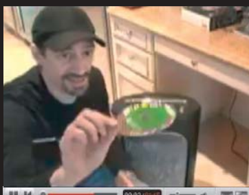
VISTA INSTALL IN 2 MINUTES: Návod na skartování Windows.