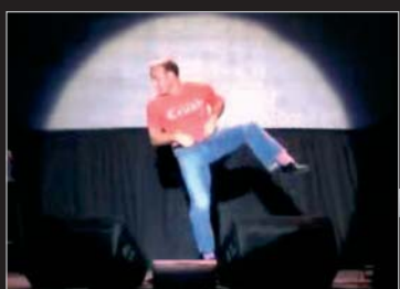
EVOLUTION OF DANCE: Nejsledovanější video všech dob.