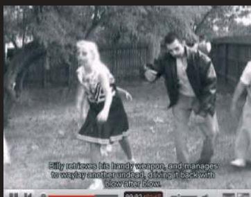
ZOMBIE ATTACK: Satirický rádce pro americkou rodinu.