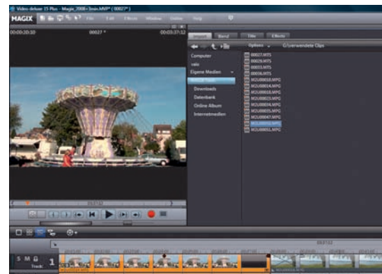
Mnoho funkcí: Vítěz testu Magix nabízí nejvíce možností editace.

Problém Magixu: Program sice působí velmi přehledně a má jasnou strukturu, problém se však skrývá v detailu, a detailů, tedy editačních možností, nabízí Magix nejvíce ze všech. Program se silně rozvíjí do mnoha submenu, a proto je často potřeba požadovanou volbu cíleně vyhledávat. Také Adobe Premiere umožňuje snadnou práci pouze na první pohled. Roz-