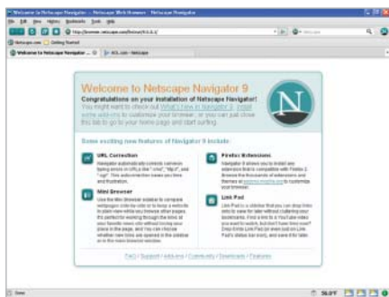
NETSCAPE: Přestože je jeho „základem“ Firefox 2, jeho tvůrci se snažili přidat i řadu vlastních funkcí.

→ očekávaný Netscape Navigator 9 (dále jen NN9). Kdysi šlo o nejoblíbenější prohlížeč, na konci devadesátých let jej však poslal do zapomnění Internet Explorer. Dodnes se příznivci obou prohlížečů dohadují, jestli Netscape padl kvůli své nedokonalosti, nebo kvůli integraci IE do Windows 98. Nyní se po několika měsících vývoje objevuje devátá verze Netscapu, která se vrací k původnímu názvu Netscape Navigator a která je na rozdíl od předchozí (osmé) verze opět multiplatformní, takže nový Netscape mohou vedle uživatelů Windows vyzkoušet i uživatelé Linuxu nebo Mac OS X. Tato změna mimo jiné znamená, že devítka na rozdíl od osmičky již neumí přepínat renderovací jádra, a sází tedy výhradně na Gecko. Ostatně Netscape Navigator 9 vychází z Firefoxu 2. Zlí jazykové dokonce říkají, že jde jen o jinak vypadající Firefox. Ostatně i rozšíření pro FF2 jsou kompatibilní s NN9.