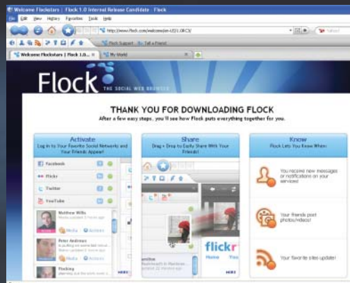
FLOCK: Propojen s nejoblíbenějšími Web 2.0 službami...