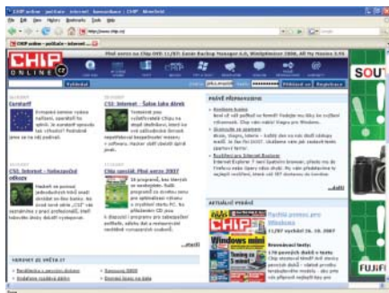
FIREFOX: Třetí generace Firefoxu přichází se spoustou dílčích vylepšení.

Změn je mnoho a už alfa verze, které jsme měli možnost testovat, naznačují, že