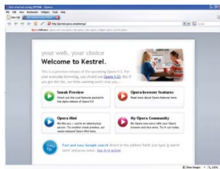
OPERA: Díky službě Opera Link můžete synchronizovat osobní nastavení.

Pokud používáte Operu na více počítačích, může vám přijít vhod nový systém synchronizace dat, jako jsou záložky nebo odkazy na obrazovce Speed Dial pro snadný přístup k často navštěvovaným stránkám ihned po startu prohlížeče. Přes portál My Opera můžete automaticky synchronizovat tato osobní nastavení mezi více prohlížeči a díky službě Opera Link i mezi Operou na stolním počítači a Operou Mini ve svém mobilu. Funkci Opera Link bude podporovat Opera Mini 4, která se v době psaní tohoto článku testuje.