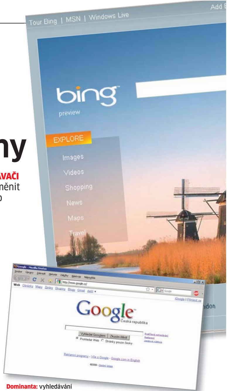
Dominanta: vyhledávání v současnosti dominuje Google.

Příklad sémantického vyhledávání: Pokud vložíte výraz „axes“,